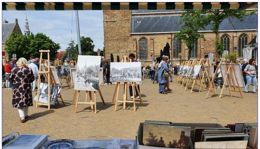
Het HCF presenteerde zich tijdens de Academische Dagen 2022 op de Breedeplaats