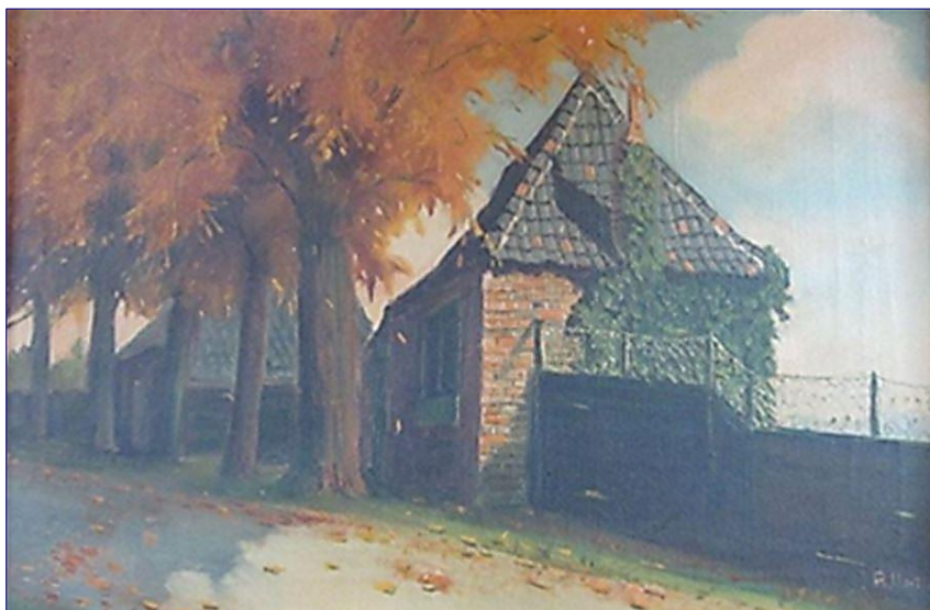
Schilderij 'Theehuisje op het Noorderbolwerk'