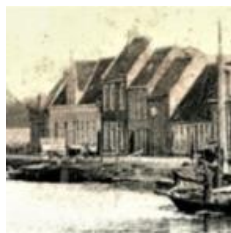
Het hoge pand in het midden aan de Tuinen was café "It Paradyske".