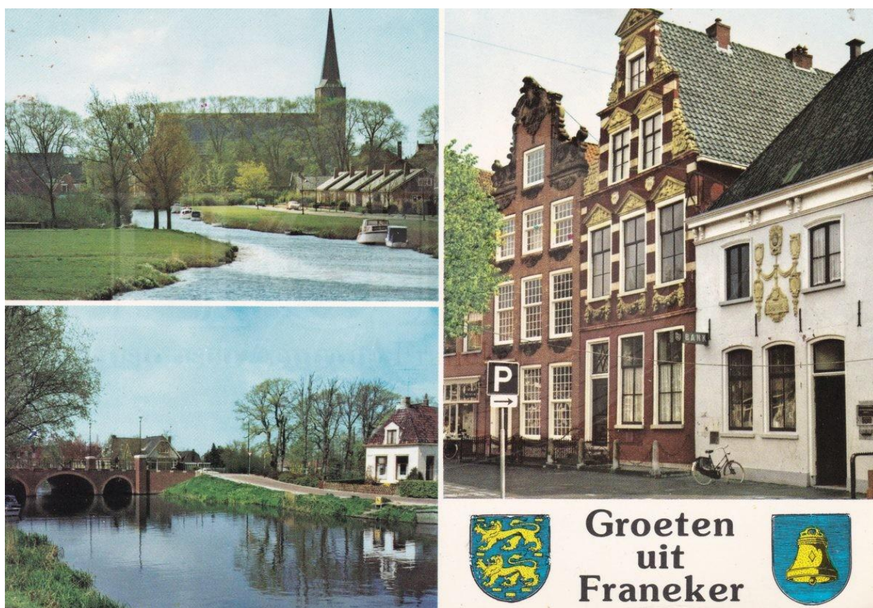
Ansichtkaart, datering 27-3-1975