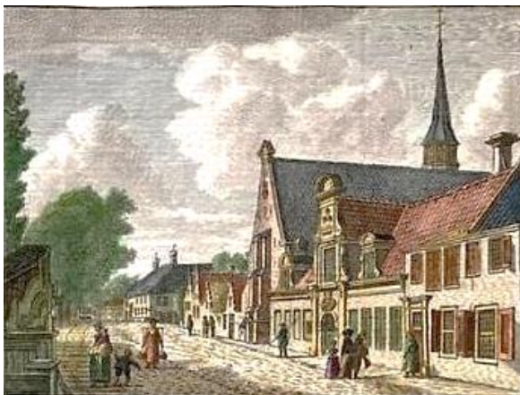
DE HOOGHE SCHOOL TE FRANEKER.